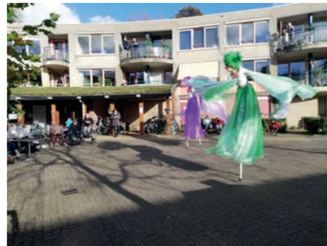
De bewoners van de woonzorglocaties, op deze foto van De Blinkert, werden getraakteerd op een magische dansvoorstelling op stelten van de Joywalkers.