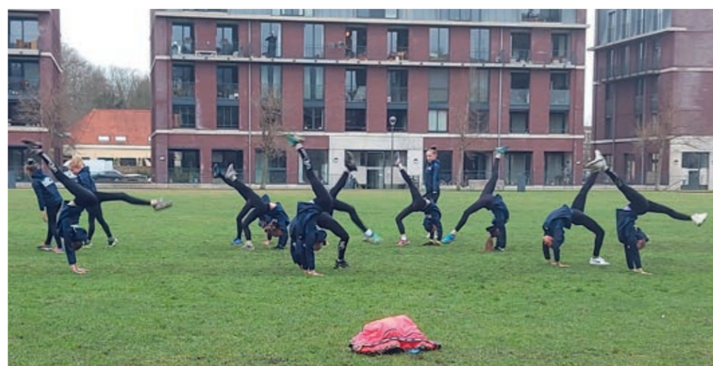
Turnvereniging Bato geeft een prachtig optreden op het veld voor Overspaarne. Bewoners bewonderen vanachter het raam het sportieve spektakel.