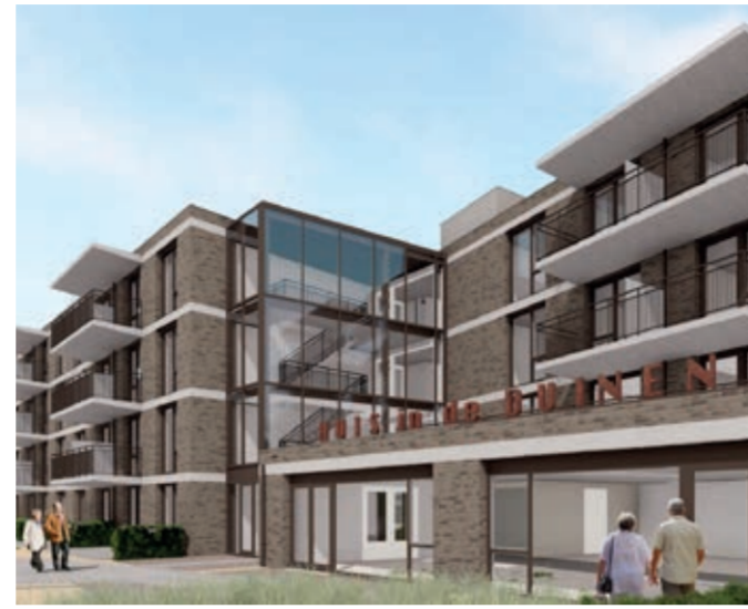
Impressie nieuwbouw Huis in de Duinen

We hechten daarnaast veel waarde aan het verkleinen van onze ecologische voetafdruk. Daarom hebben we ons onder andere geïnteresseerd aan de Green Deal en wordt er systematisch gewerkt aan het verduurzamen van de bedrijfsvoering.