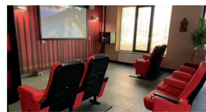
Eén van de belevingshoeken in Overspaarne: de bioscoop

een bushoek. Met busstoelen en met stadsbeelden van een busrit zodat de bewoners een rondje mee kunnen rijden.