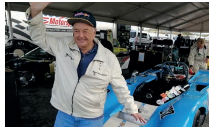
VERRASSING OP HET ZANDVOORTSE CIRCUIT