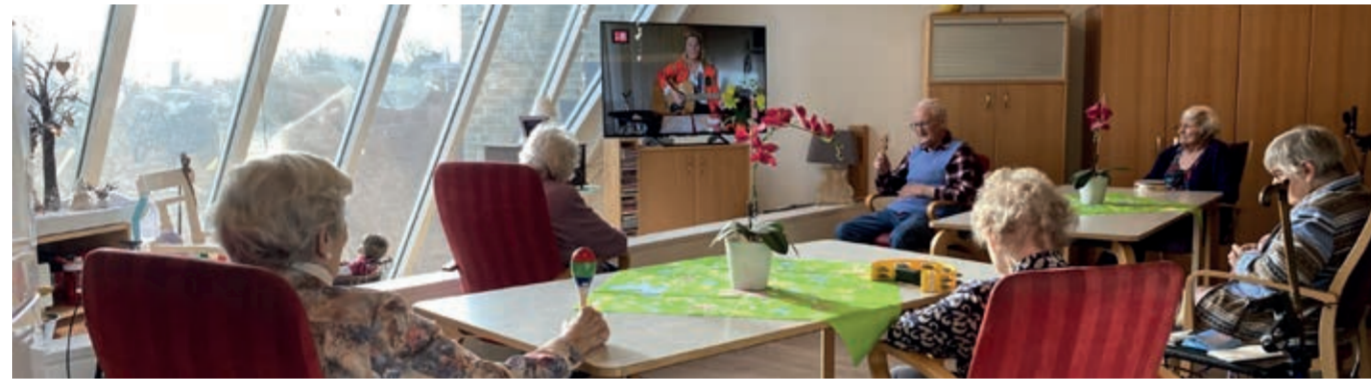
Huiskamerconcert in De Rijk

In de Janskliniek zijn er sinds kort 'pushpong' toernooien, dankzij de door Stichting Steunfonds