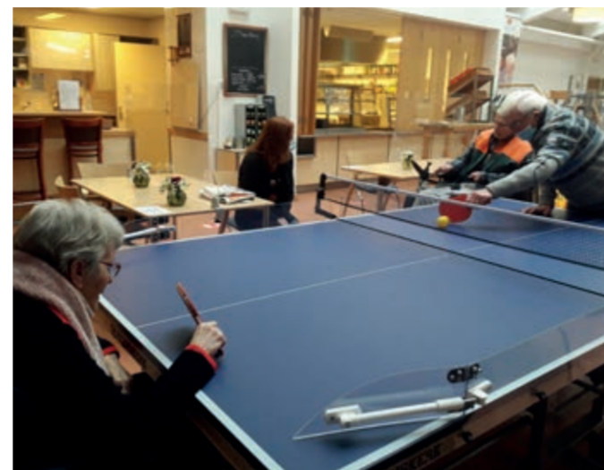
Pushpongen. Meedoen is belangrijker dan winnen? Dat vinden deze fanatieke bewoners van de Janskliniek niet.