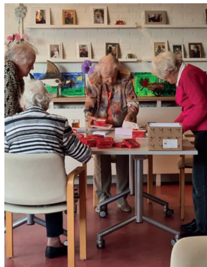
Deelnemers van Kennemerhart Oppeppers pakken lichtjes in voor thuiswonende cliënten. Eentje voor henzelf en eentje om weg te geven.