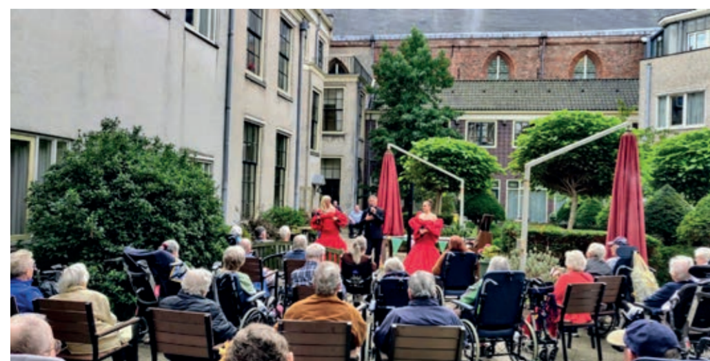
De bewoners en medewerkers van de Janskliniek genoten in de binnentuin van het openluchtconcert van het muzikale gezin Opera Familia. Het thema was Bella Italia.