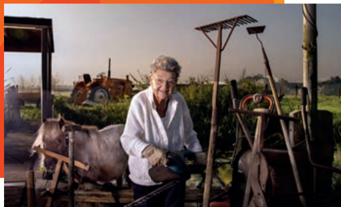
VERHALEN VAN PASSIE